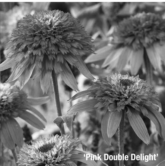
'Pink Double Delight'