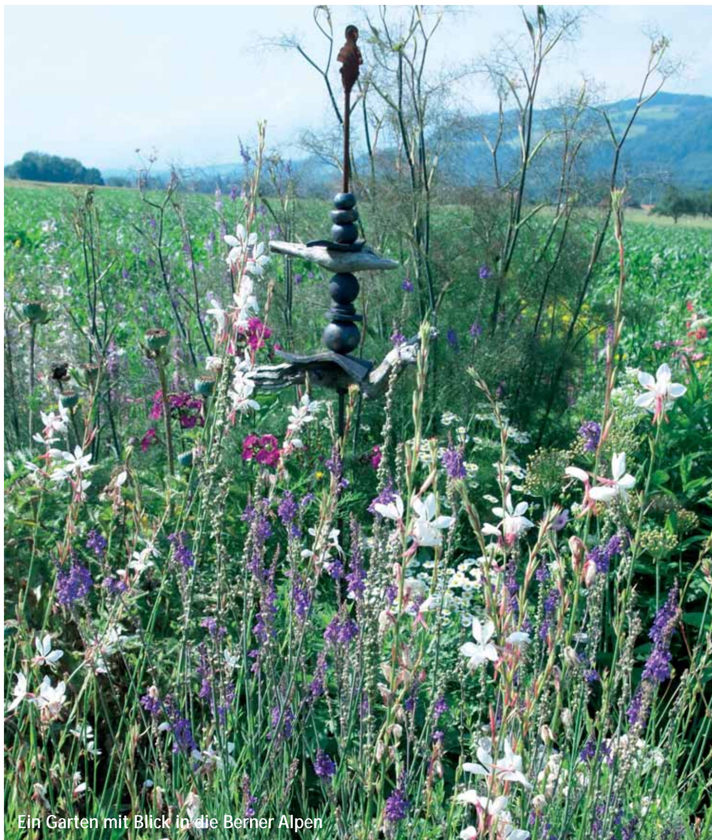
Ein Garten mit Blick in die Berner Alpen